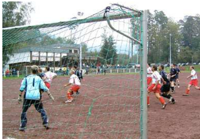
"Der Ball rollt wieder beim SVM"

Wiesentalstraße 1 - 76571 Gaggenau-Michelbach - Telefon 07225 / 2492 Im Internet unter www.kraemerreisen.de - eMail: KraemerReisen@aol.com